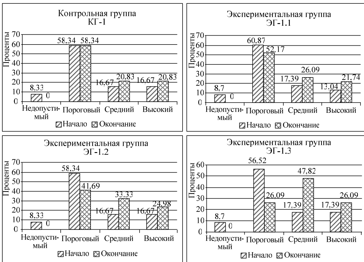
Рисунок 2 – Динамика уровней сформированности ОУК бакалавров в первой части формирующего этапа опытно-поисковой работы

Перевод образовательной системы в состояние опережающего развития осуществлялся в три этапа. Было выполнено четыре среза. Нулевой срез производился перед началом когнитивно-ориентирующего этапа, первый – после окончания данного этапа, второй – в конце деятельностно-продуктивного этапа, третий – в конце личностно-преобразующего этапа (рисунок 2). Полученные данные наглядно отображают динамику увеличения суммы среднего и высокого уровней сформированности ОУК во всех группах, что свидетельствует о переходе педагогической системы в состояние опережающего развития.