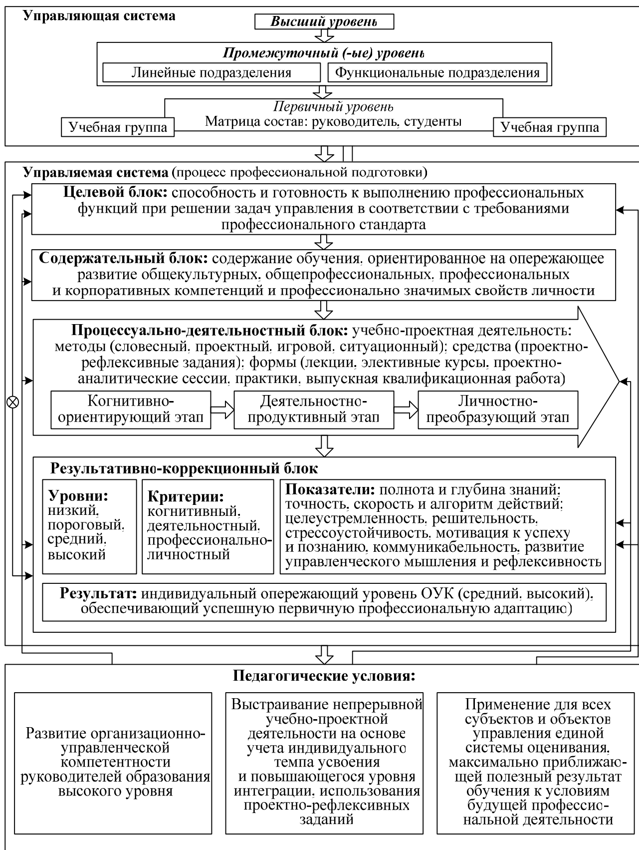
Рисунок 1 – Модель системы опережающей профессиональной подготовки бакалавров