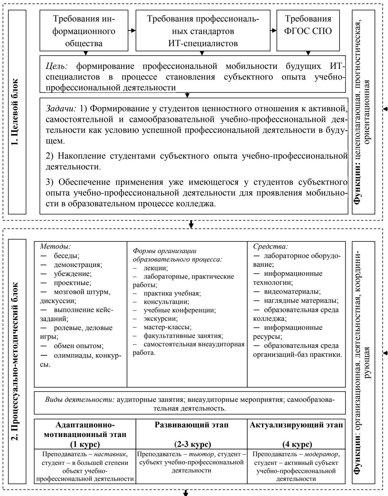
Рисунок 3 – Структурно-функциональная модель формирования профессиональной мобильности будущих ИТ-специалистов в процессе становления субъектного опыта учебно-профессиональной деятельности